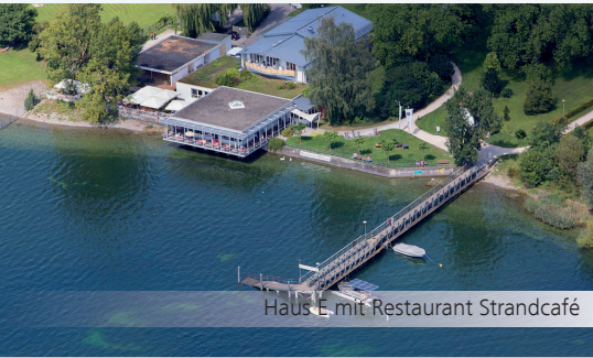
Haus E mit Restaurant Strandcafé