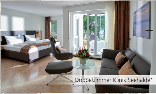
Doppelzimmer Klinik Seehalde*