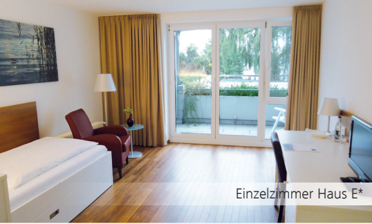
Einzelzimmer Haus E*