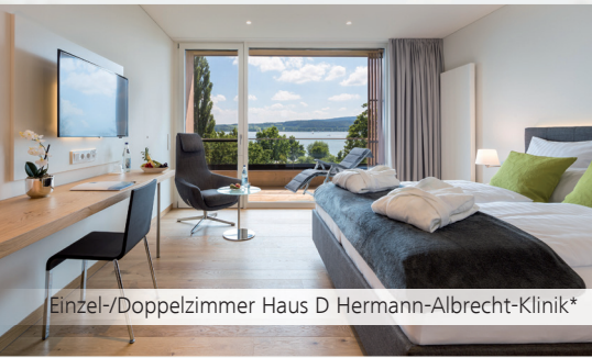
Einzel-/Doppelzimmer Haus D Hermann-Albrecht-Klinik*