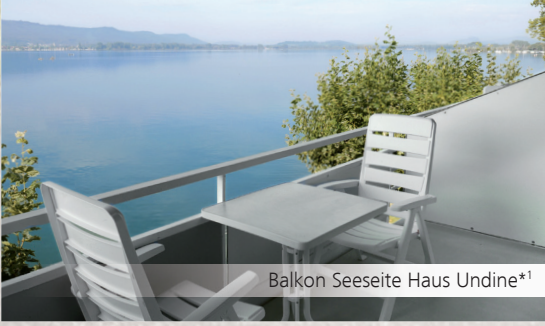
Balkon Seeseite Haus Undine*1