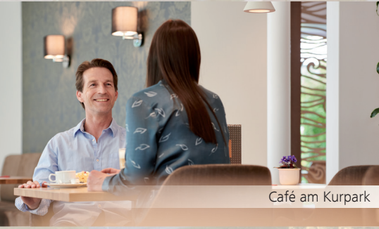
Café am Kurpark