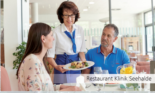
Restaurant Klinik Seehalde