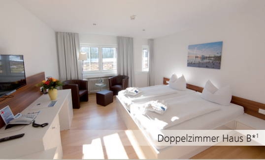
Doppelzimmer Haus B*1