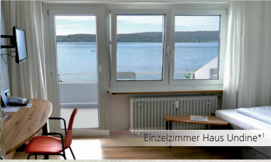
Einzelzimmer Haus Undine*1