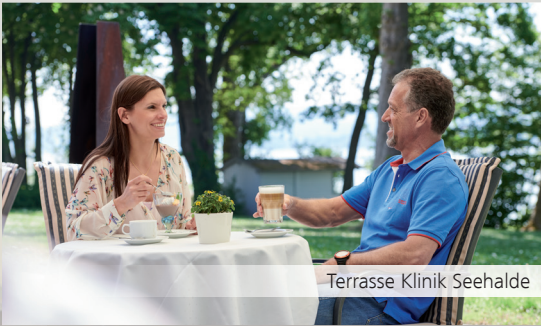
Terrasse Klinik Seehalde