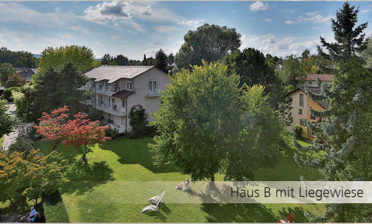
Haus B mit Liegewiese