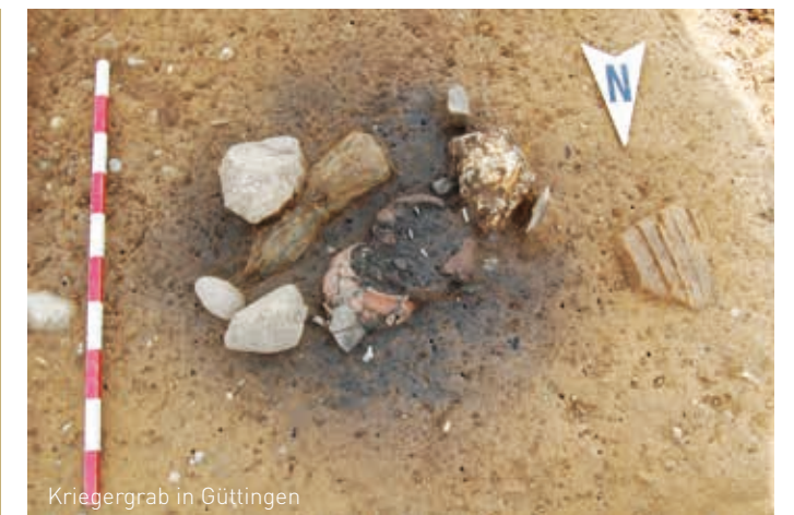
Kriegergrab in Göttingen

www.stadtmuseum-radolfzell.de Tel. 07732 / 81530 (Kasse Museum)