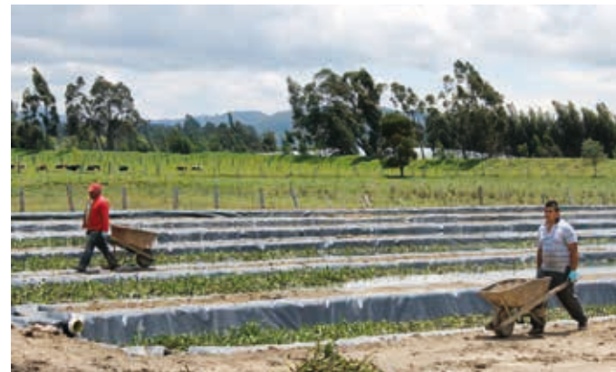
Projekt „Grünfilter – Innovative und kostengünstige Abwasserreinigung“