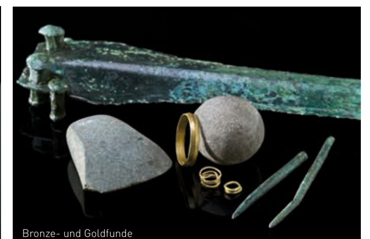
Bronze- und Goldfunde