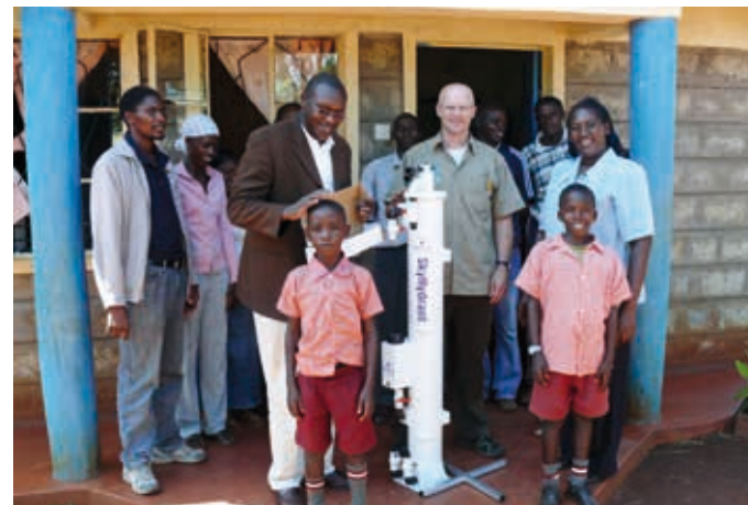
Die Zusammenarbeit mit der Bevölkerung vor Ort ist bei allen Projekten des Global Nature Fund der Schlüssel zum Erfolg.

Ich habe in den letzten 20 Jahren größere Teile der Welt kennenlernen dürfen und es gibt eigentlich keinen Ort, an dem ich lieber leben möchte. Ich liebe unsere Region mit ihrer Vielfalt an Kultur und Natur. Innerhalb der Bodenseeregion ist Radolfzell eine interessante Stadt. Die naturnahen Uferzonen des Untersees und die Naturschutzgebiete machen diese Region für mich besonders attraktiv.