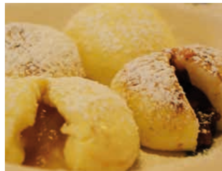
TEXT MARINA KUPFERSCHMID