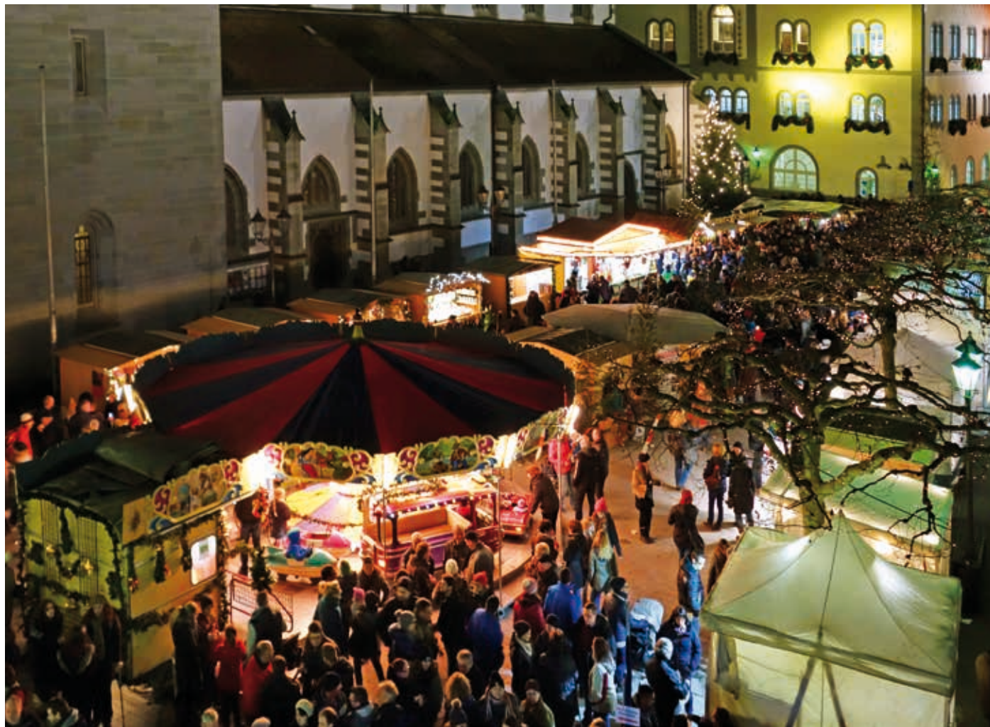
TEXT BARBARA BURCHARDT