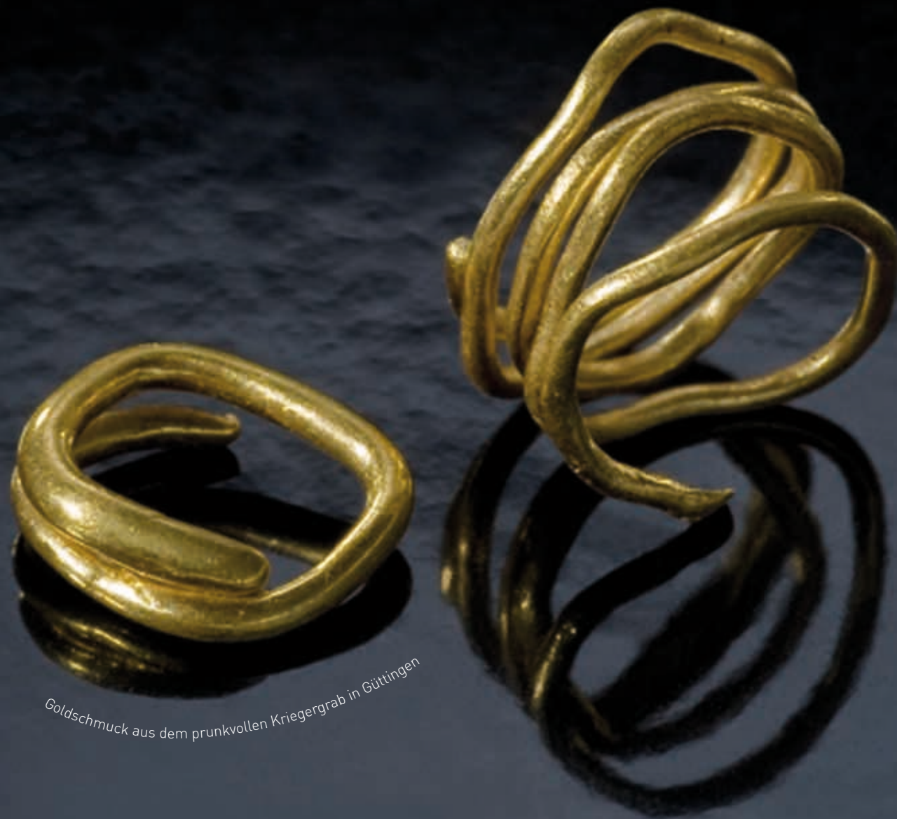
Goldschmuck aus dem prunkvollen Kriegergrab in Göttingen