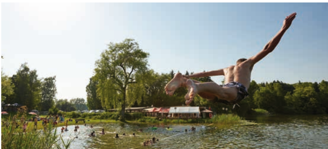
Sprung ins kühle Nass

Radolfzell am Bodensee – das ist eine klare Ansage für die traumhafte Lage der Stadt am See. Einmalig ist Radolfzell aber auch für seine zahlreichen Seen im unmittelbaren Umland. Keine Stadt und keine Gemeinde in Baden-Württemberg hat mehr zu bieten.