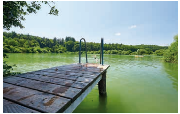
Romantischer Buchensee bei Güttingen