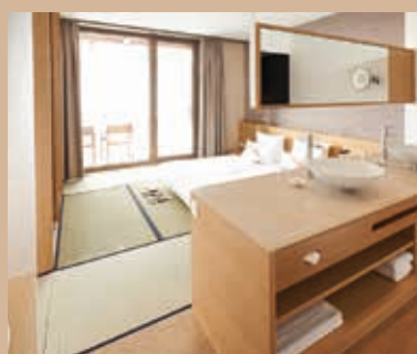
Karl-Wolf-Str. 35 D - 78315 Radolfzell