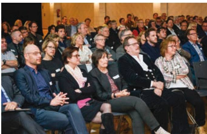
Aufmerksam lauschten die Teilnehmer dem spannenden Thema.

Beim anschließenden „Dialog im Foyer“ nutzten wieder viele Teilnehmer die Gelegenheit zum Gedankenaustausch und Kontakte knüpfen. Nach wie vor dient das Unternehmerforum hervorragend der Vernetzung.