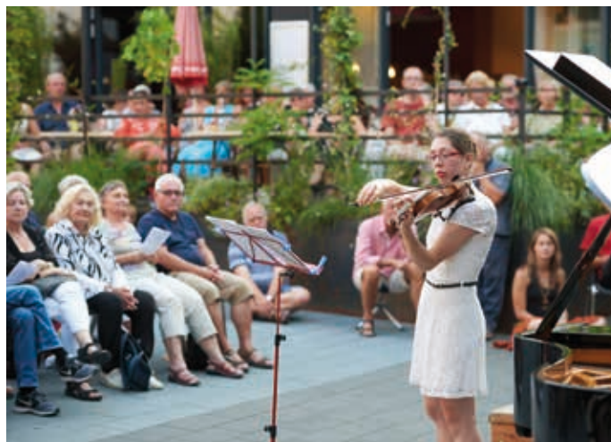
Open-Air-Konzert der Meisterkurse in der Altstadt.