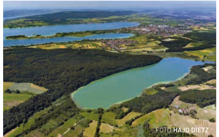
Malerischer Mindelsee, im Hintergrund der Untersee