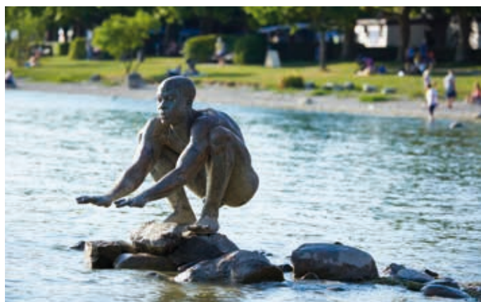
TEXT MARINA KUPFERSCHMID

Wer kennt ihn nicht. Er ist jung und knackig und wird einfach nicht älter. Die Jahre prallen an ihm ab wie nichts und zudem genießt er die beste Aussicht von allen, zu jeder Jahreszeit und an jedem Tag, ganz egal, ob es regnet oder schneit, ihm das Wasser bis zum Hals steht oder er auf dem Trockenen sitzt – El Niño. Längst ist die Figur im See an der Radolfzeller Hafenmole zu einer Art Wahrzeichen Radolfzells geworden und immer gut für ein Foto-Motiv. El Niño wird von vielen Einheimischen und Besuchern auch zur Einschätzung des Wasserspiegels genutzt, denn je nach Wasserstand sieht man mal mehr und mal weniger von der Statue. Geschaffen wurde die Bronzeskulptur vom renommierten Bildhauer Ubbo Enninga, der sie der Stadt nach einer Ausstellung in Radolfzell zunächst leihweise überließ. Dank einer groß angelegten Spendenaktion konnte die Stadt das Kunstwerk 1997 kaufen. Seither prägt die lebensechte wirkende Skulptur das Radolfzeller Seeufer und sorgt für große Aufmerksamkeit.