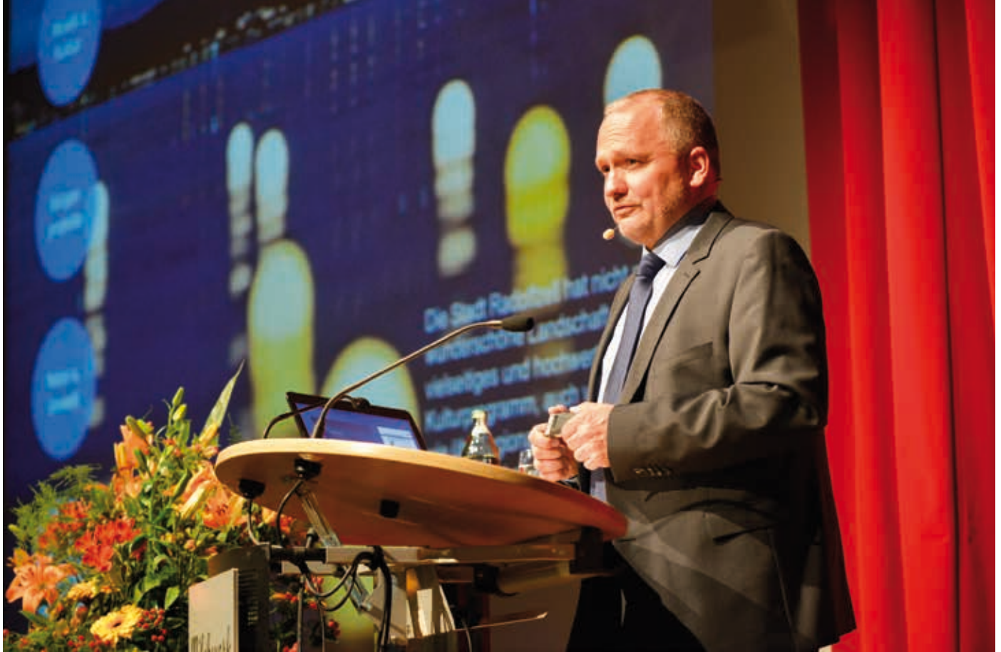
Oberbürgermeister Martin Staab begrüßte die Gäste und eröffnete das 8. Unternehmerforum.