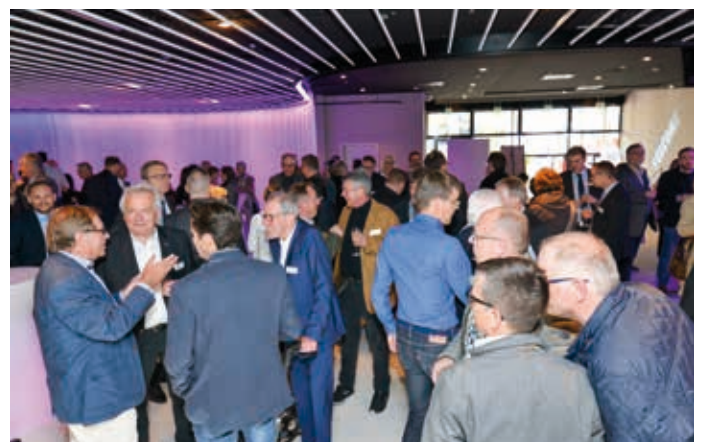
Dialog im Foyer.

TEXT KUPFERSCHMID UND MARIANNE LINDENTHAL