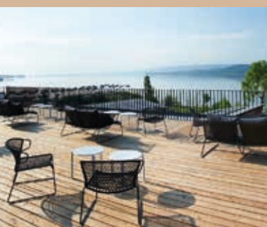
bora HotSpaResort ****