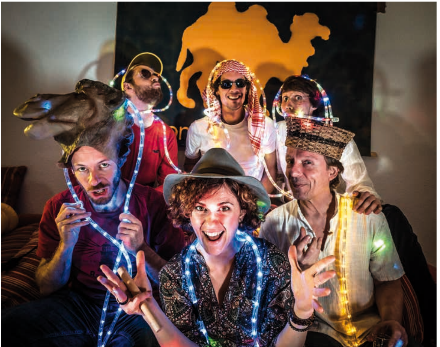
Die Band „Contrast Orange“ sorgt auf dem Marktplatz für gute Stimmung, der Kinderflohmarkt erfreut sich großer Beliebtheit und auch für das leibliche Wohl ist bestens gesorgt.